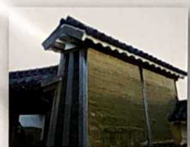
Abura kabe (Muro del aceite)

Es un muro de tierra hecho con varias capas de lodo y arena apisonadas. Es tan duro y resistente que incluso frena el paso de las balas.