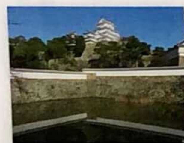
Sangoku Bori (Foso Sangoku)

Se encuentra en una posición importante en el nexo con Ni no Maru. Está situado de manera que provocaba la dispersión de las tropas invasoras y permitía disparar por los flancos a los enemigos.