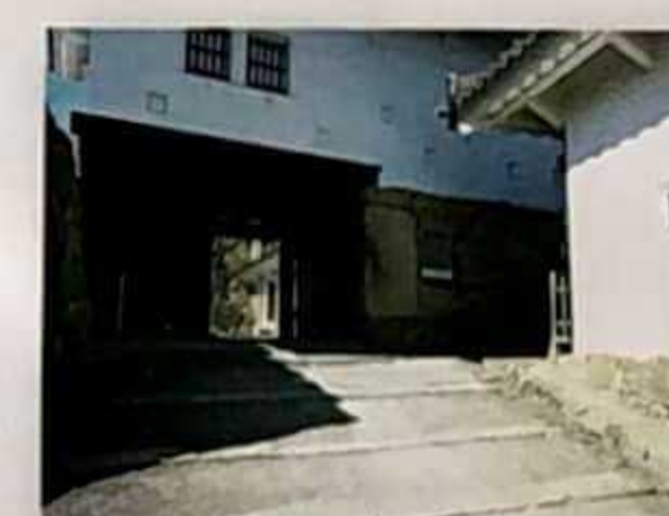
Bizen mon (Puerta Bizen)

Es la puerta de entrada principal a Bizenmaru. Su portón está reforzado con placas de hierro.