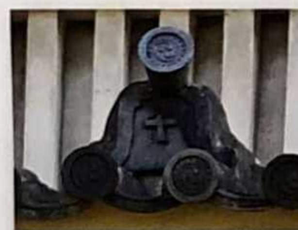
Jujimon Gawara (Teja con emblema de cruz)

Es una rara teja del castillo con un emblema en forma de cruz. Se piensa que podría indicar que el señor feudal anterior a la fundación del castillo era cristiano.