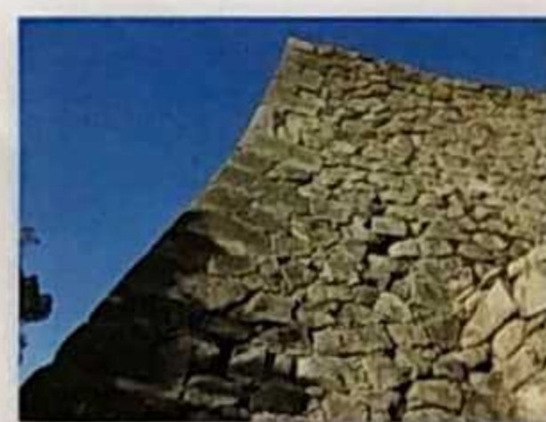
Ogi no kōbai (Pendiente de abanico)

Este muro de piedra tiene el nombre de "Pendiente de abanico" porque su forma recuerda a las líneas curvas que tiene un abanico abierto. Su pendiente se hace más pronunciada a medida que gana altura para impedir así que el enemigo trepe el muro.