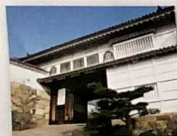
Hishi no Mon (Puerta Hishi)

Es la puerta grande de mayor prestigio en el interior del castillo. Sus ventanas están lacadas en negro y adornadas con hojas doradas.